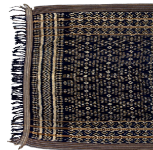
בד איקט ארוג מכותנה, אזור קודי, סומבה המערבית, אינדונזיה, 1850-1940, חפץ מס' NK1113, מימדים 137 על 260 ס"מ.