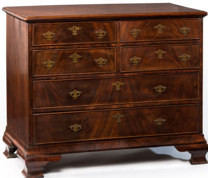
מקורה של שידת מגירות זו, שיש לה מעט מאפיינים ייחודיים, אינו ידוע

"טיפול זהיר והוגן בבקשות ההשבה הוא חיוני", אמרה שרת התרבות בשנה שעברה, "מכיוון שהשבה היא יותר מסתם החזרת חפץ תרבותי. זוהי הכרה בעוול שנגרם לבעלים המקוריים ותרומה לתיקון העוול הזה". כל אחד יכול להגיש בקשה להשבת חפץ מאוסף האמנות הלאומי לסוכנות הממשלתית. לאחר מכן שרת התרבות אם חפץ האמנות יוחזר. השר אינו מקבל החלטה כזו בקלות דעת. ראשית, "הוועדה המייעצת לבקשות השבה של חפצי תרבות ומלחמת העולם השנייה" נותנת את עצותיה באופן עצמאי. הוועדה מנסה לקבוע