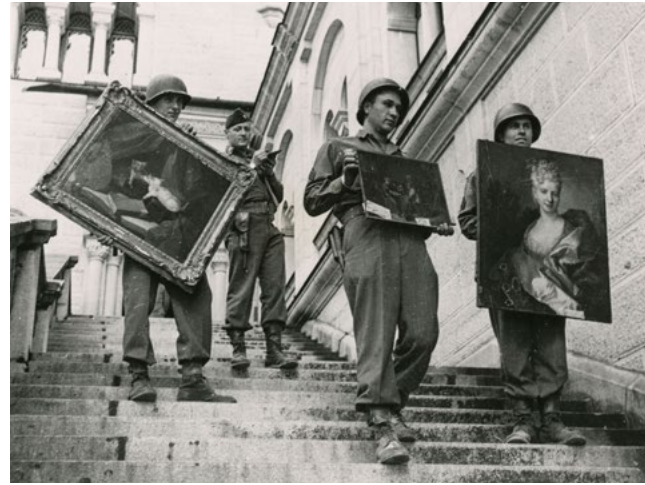
בתום המלחמה, בעלות הברית החזירו הרבה אמנות שנבזזה

שלא מרצון בין השנים 1933 ל-1945. מדובר גם בסחורה שנמכרה מרצון.