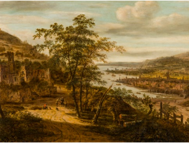
נוף הנהר' הזה של דיוניס ורבורג מחכה להחזרה