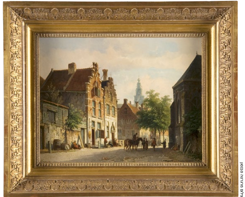
הנוף העירוני הזה של אדריאנוס אוורסן הוחזר ליורשים

כי סביר מאוד שהמבקש הוא הבעלים המקורי או יורשו החוקי. וכי סביר למדי שאבדן החזקה בתקופת המשטר הנאצי התרחש בעל כורחו. אם שני הדברים צולחים, ממליצה הוועדה להחזיר את יצירת האמנות. היא מבססת את עצותיה על מחקר היסטורי.