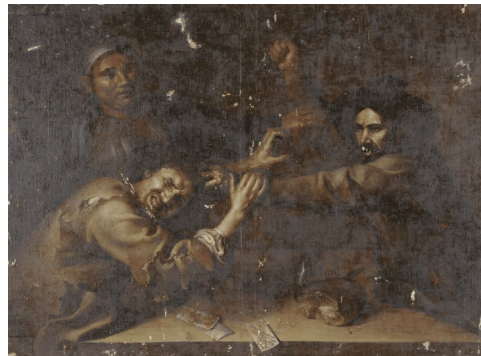
Onbekend, Vechtende kaartspelers , onbekend jaar, inv. nr. NK3533