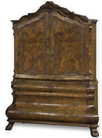
לא ידוע, ארון קבינט מעץ אגוז פורניר עם קישוטי נחושת, 1765. מספר מצאי NK259 במידות 233 ס"מ על 172 ס"מ על 66 ס"מ.