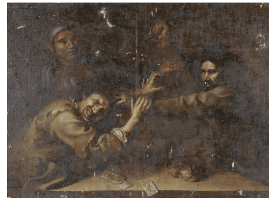
לא ידוע, שחקני קלפים רבים, שנה לא ידועה, מס' NK3533.

בניוזלטר זה אנו מביאים לכם מידע על הפעילות של "הסוכנות הממשלתית למורשת התרבות" (RCE) בנושא נכסי התרבות שנבזזו, הוחרמו או נמכרו בכפייה לפני או בזמן מלחמת העולם השנייה. כמו כן אנו מפנים אל מידע מעניין של הארגונים שעמם אנו משתפים פעולה באופן הדוק, כגון "ועדת ההשבה" ו"המכון לחקר המלחמה, השואה ורצח עם" (NIOD).